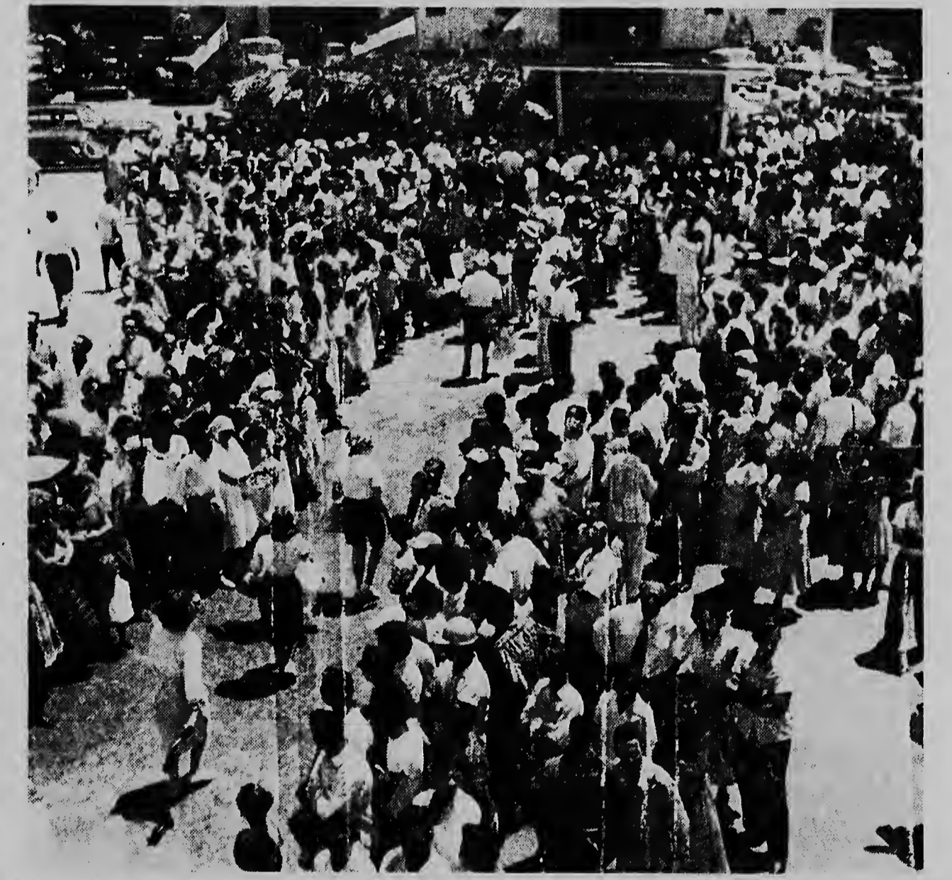
Manera y portret ta muestra, hende tur rond, y mel mei di nan toeristanan ta pasa bal na e ramada di coco na unda e „Aruba Cocktail“ ta worde sirbi.